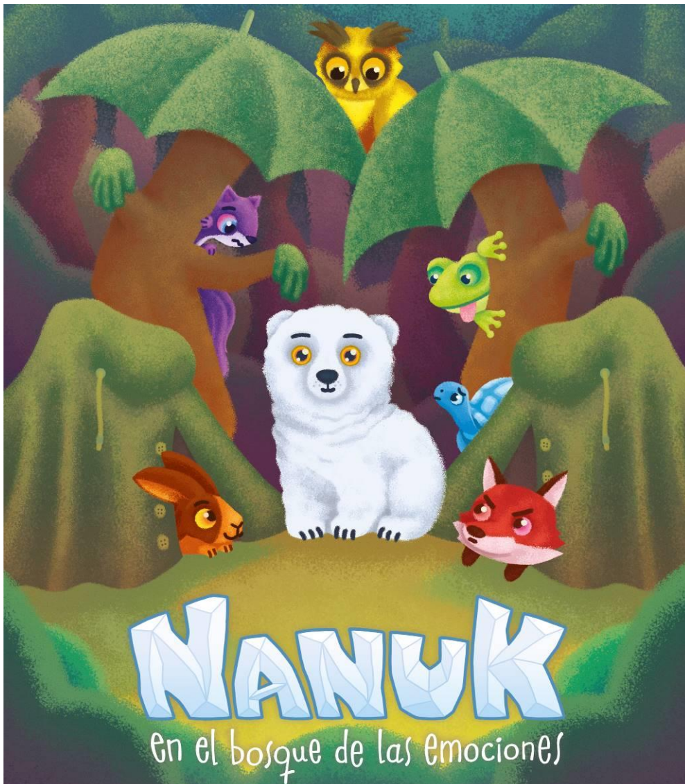
El cartel del espectáculo